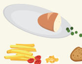
Restes alimentaires, pain, frites, riz, pâtes, ...